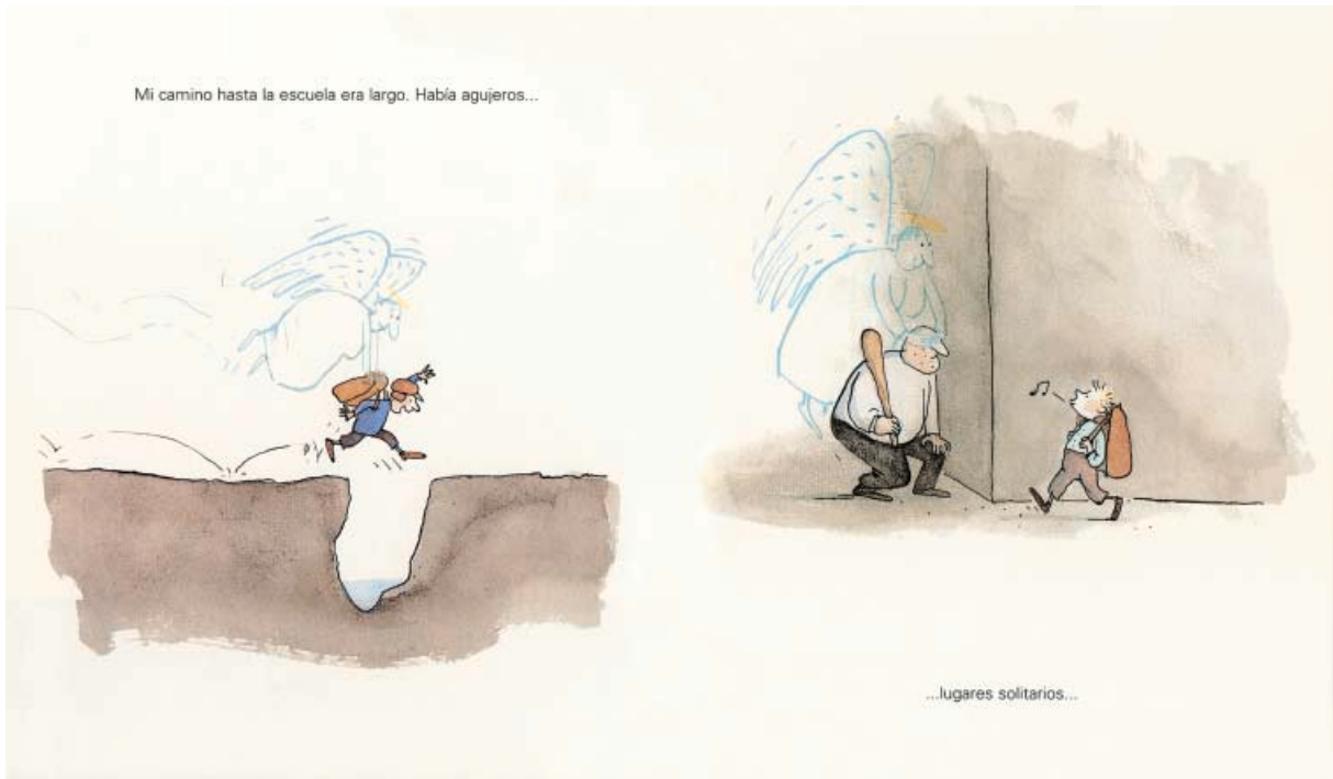
2001. Jutta Bauer. El ángel del abuelo .