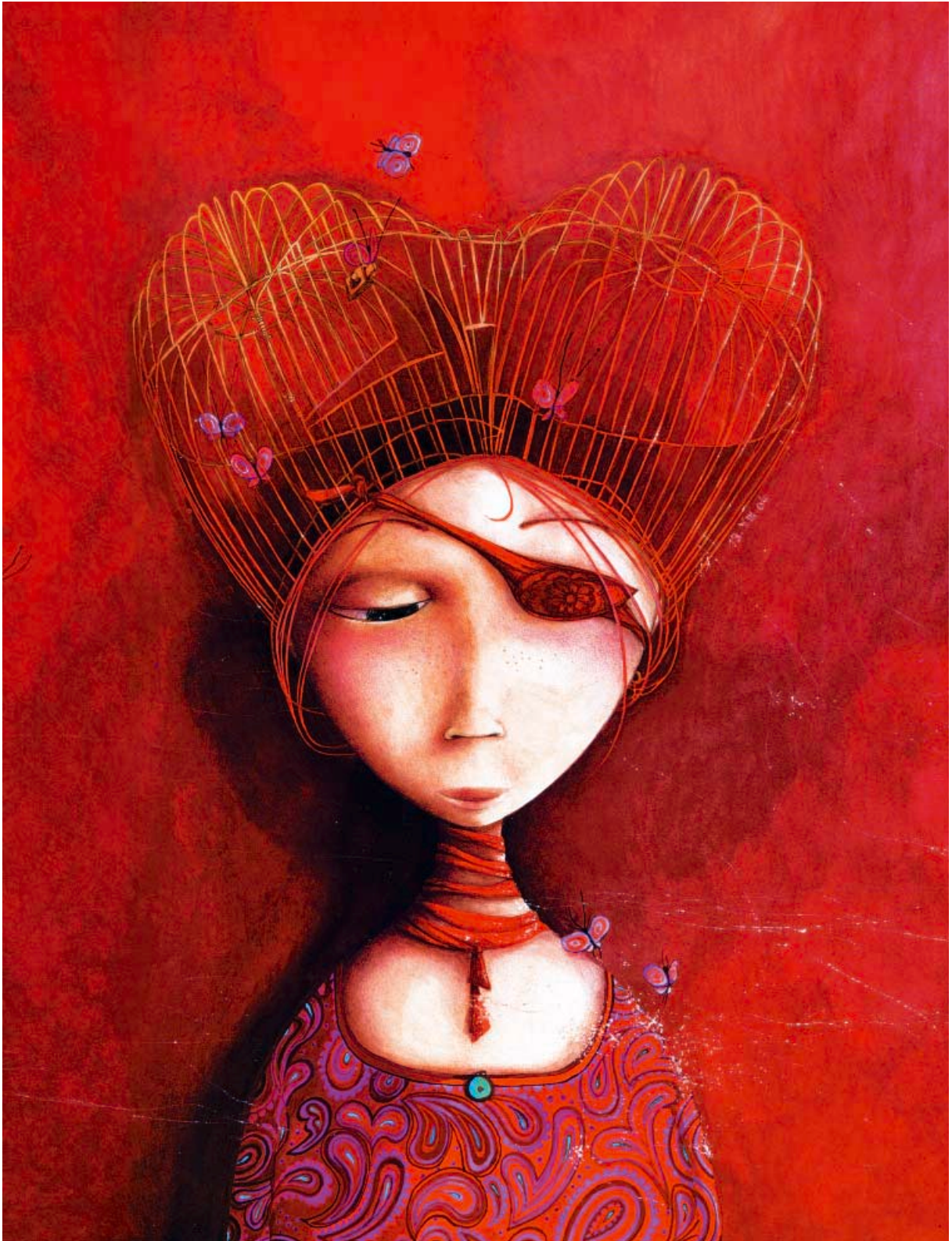
2004. Rébecca Dautremer. Princesas olvidadas o desconocidas . Texto de Philippe Lechermeier.