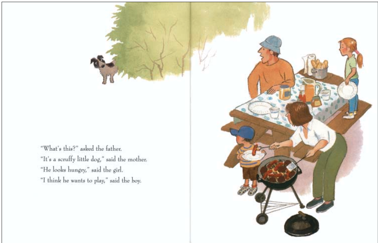
2001. Marc Simont. The Stray Dog .